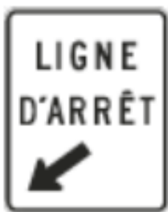
Ligne d'arrêt (P-060-D)

Si le panneau « Signal avancé du signaleur routier » n'est pas présent sur le site des travaux ou du plateau de tournage, le signaleur doit aviser son supérieur immédiatement.