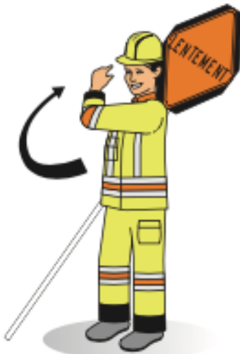
Ordre de circuler