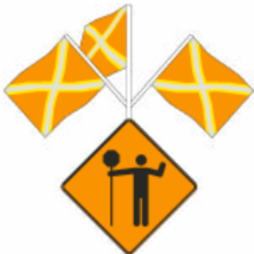
Signal avancé du signaleur routier (T-60)

Le panneau « Signal avancé du signaleur routier » et le panneau « Ligne d'arrêt » sont directement liés au signaleur routier