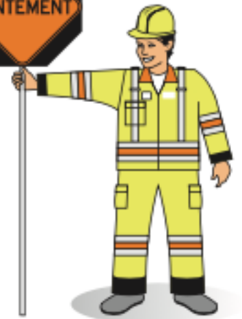
Ordre de ralentir