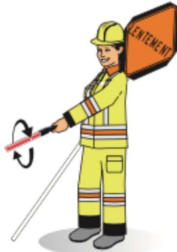
Ordre de circuler