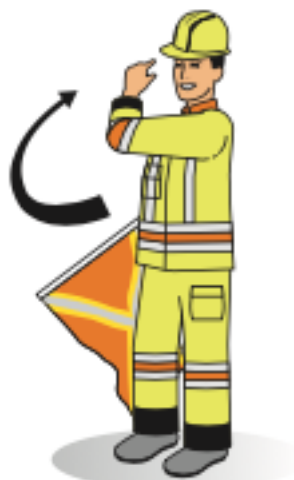
Ordre de circuler